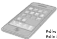
Mobiles Gerät Mobile device